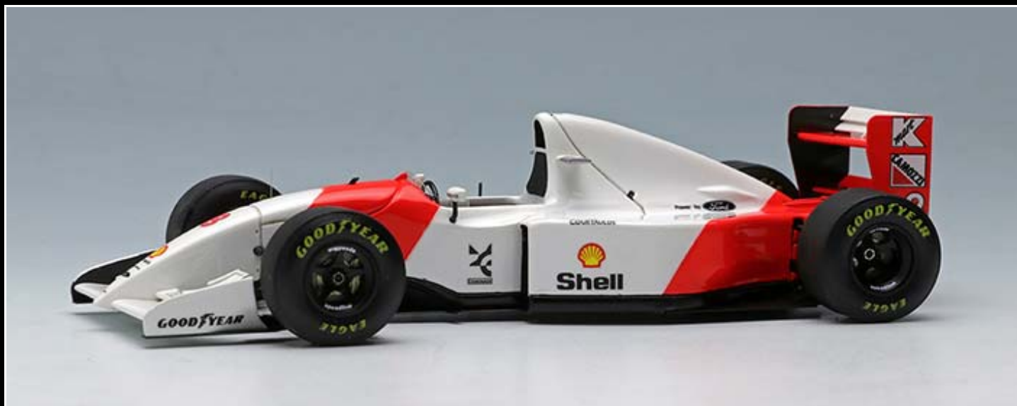
FE028A : No.8 A. Senna

FE028 McLaren Ford MP4/8 Japanese GP メーカー希望小売価格: 各 28,500円(税別)