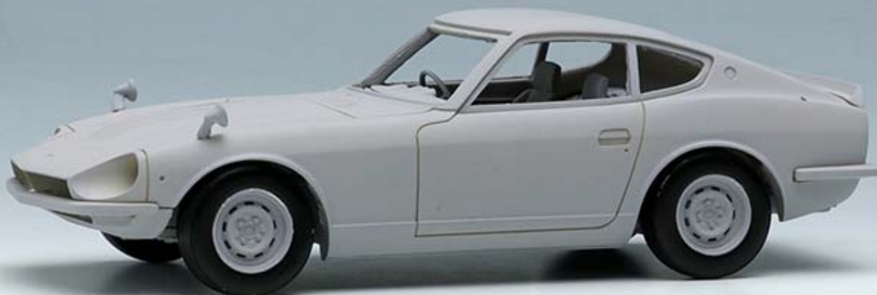
VM120A : Steel Wheel